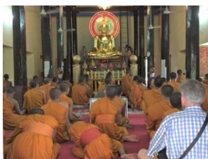
読経を唱える僧侶