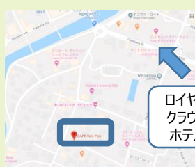
ロイヤルクラウンホテル

【行事紹介】9月はお盆(プチュンバン)があります。★祖先祭祀の意味をもつ仏教儀礼