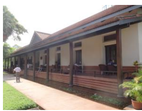
図書館内外で勉強中の若者/仏教書が多い