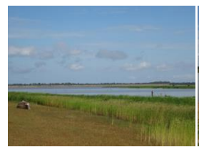
たんぼと西バライビュー

◎詳細はこちら⇒ https://orkuntour.exblog.jp/28463131/