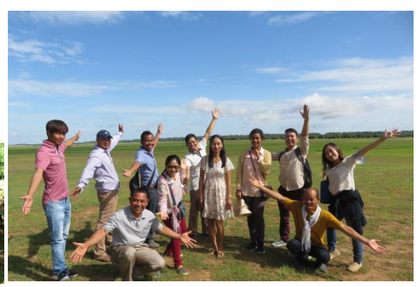
★社員全員で記念撮影★