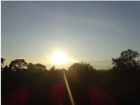
ジャングルに沈む夕日

アンコール遺跡の一つで、ヒンドゥー教寺院です。(東バライの南側/大回りコースの観光ルートのひとつ) 「プレ」は変化、「ループ」は体を意味し、かつて境内で行われたと伝わる火葬を名の由来とします。寺院は3層のラテライトの基壇上に5基の煉瓦の祠堂が並んでいるピラミッド式の寺院です。カンボジアの平原が一望でき、中央祠堂からジャングルに沈む夕日が見られます。(リピーターや、欧米人・日本人に人気です)