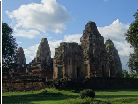
プレ・ループ全体像/急な階段を登った先に祠堂(夕陽スポット)がある