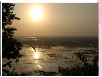
山の上から見る住居とトンレサップ湖／プノン・クロムの祠堂