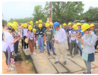
ラオ先生からの講話／石工トイさんからの切出し体験／西参道保存修復の見学